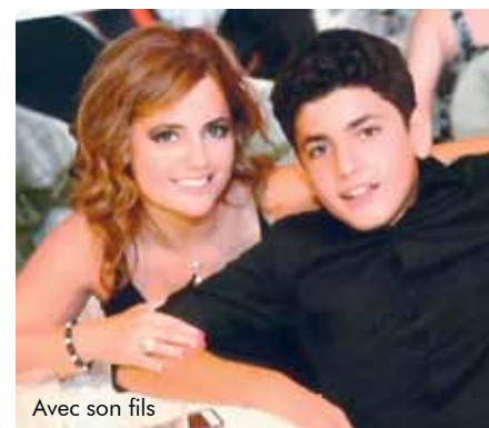
Avec son fils