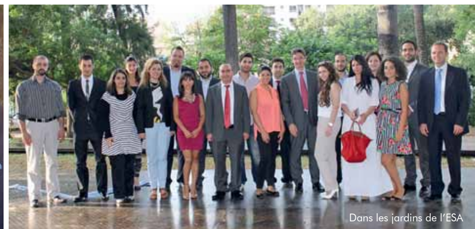
Dans les jardins de l'ESA