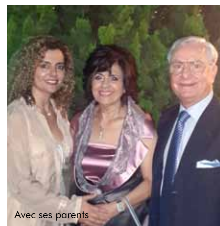
Avec ses parents

Chaque session à l'ESA est un nouveau projet pour moi. On a continuellement de nouveaux challenges avec nos clients à la suite de complications, de l'innovation de la technologie et des défis du monde des ressources humaines.